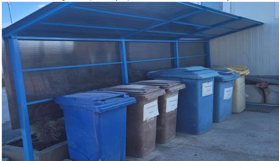
-zona depozitare temporara deseuri-