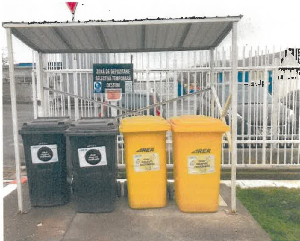
-zona depozitare temporara deseuri-

Monitorizarea deseurilor generate se face continuu iar raportarea catre autoritati se realizeaza conform cerintelor legale, conditiile Autorizatiei de mediu sau la solicitarile Agentiei pentru Protectia Mediului. Auditarea modului de gestionare a deseurilor se face in cadrul auditurilor interne si externe de mediu.