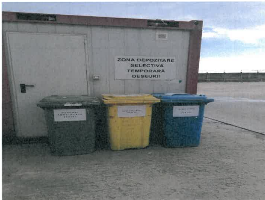
-zona depozitare temporara deseuri-

Auditarea modului de gestionare a deșeurilor se face în cadrul auditurilor interne și externe. Monitorizarea deșeurilor generate se realizează în mod continuu iar raportarea către autoritățile competente se realizează în conformitate cu cerințele legale în vigoare, cu prevederile Autorizației de mediu și cu solicitările Direcției Județene de Mediu. Prin aceste demersuri, se asigură îmbunătățirea continuă a sistemului de gestionare a deșeurilor și menținerea conformității cu cerințele legale și de mediu.