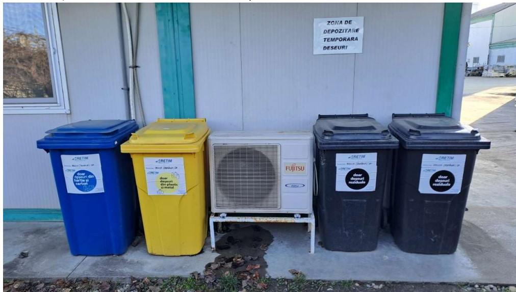
-zona depozitare temporara deseuri-

Auditarea modului de gestionare a deșeurilor se face în cadrul auditurilor interne și externe. Monitorizarea deșeurilor generate se realizează în continuu iar raportarea către autoritățile competente se realizează în conformitate cu cerințele legale în vigoare, cu prevederile Autorizației de mediu și cu solicitările Direcției Județene de Mediu. Prin aceste demersuri, se asigură îmbunătățirea continuă a sistemului de gestionare a deșeurilor și menținerea conformității cu cerințele legale și de mediu.