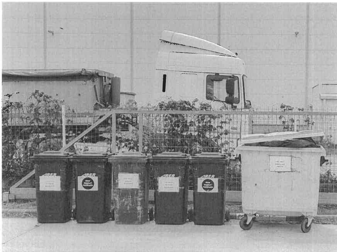
-zona depozitare temporara deseuri-

Monitorizarea deseurilor generate se face continuu iar raportarea catre autoritati se realizeaza conform cerintelor legale, conditiile Autorizatiei de mediu sau la solicitarile Agentiei pentru Protectia Mediului. Auditarea modului de gestionare a deseurilor se face in cadrul auditurilor interne si externe de mediu.