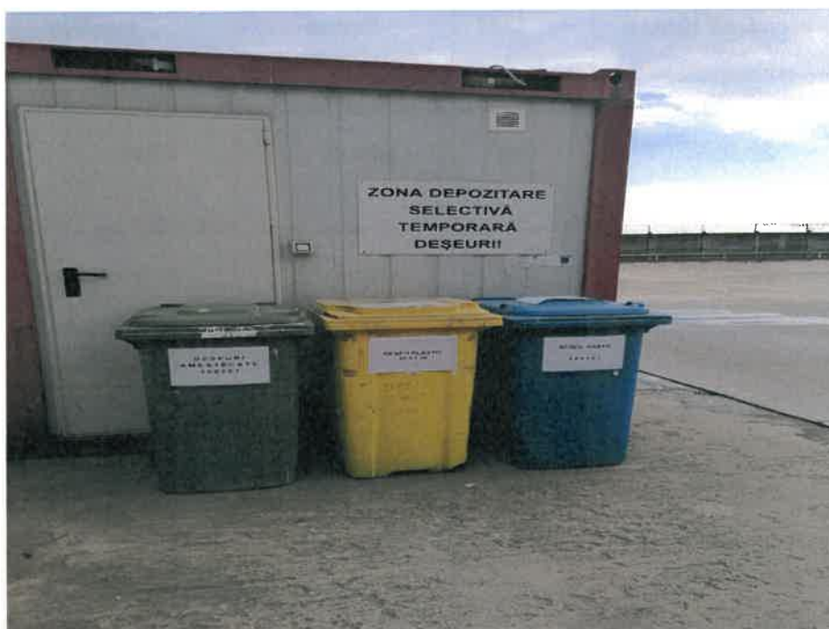
-zona depozitare temporara deseuri-