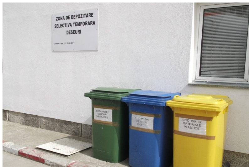
-zona depozitare temporara deseuri-