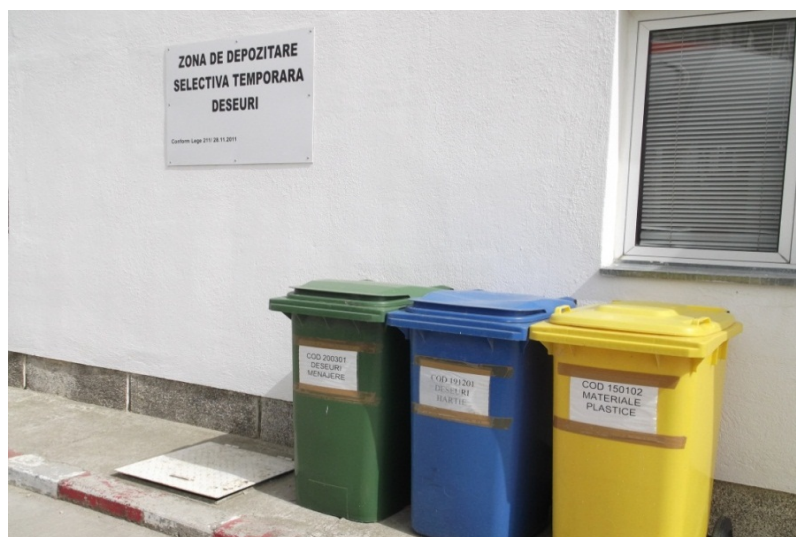
-zona depozitare temporara deseuri-