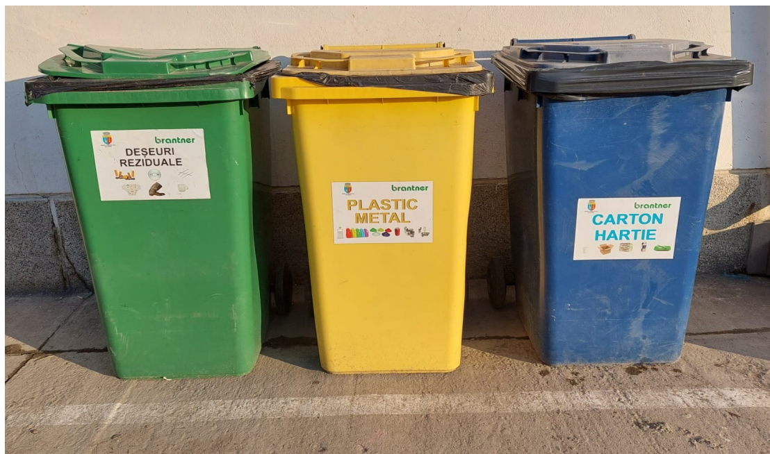
-zona depozitare temporara deseuri-

Monitorizarea deșeurilor generate se face continuu iar raportarea către autorități se realizează conform cerințelor legale, condițiile Autorizației de mediu sau la solicitările Agenției pentru Protecția Mediului. Auditarea modului de gestionare a deșeurilor se face în cadrul auditurilor interne și externe de mediu.