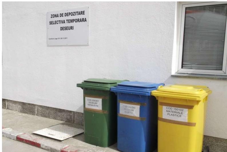
-zona depozitare temporara deseuri-