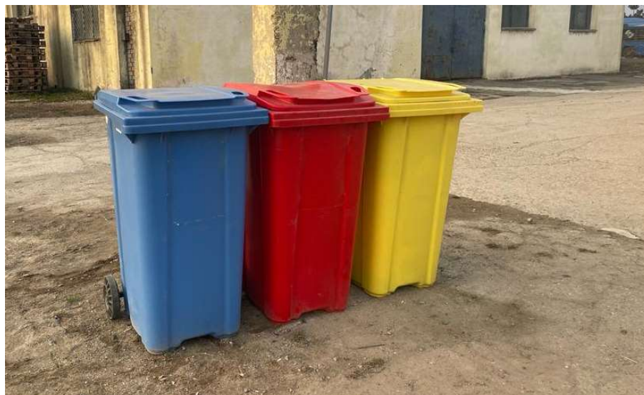
-zona depozitare temporara deseuri-