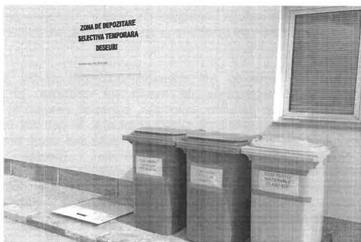
-zona depozitare temporara deseuri-

Monitorizarea deseurilor generate se face continuu iar raportarea catre autoritati se realizeaza conform cerintelor legale, conditiile Autorizatiei de mediu sau la solicitarile Agentiei pentru Protectia Mediului. Auditarea modului de gestionare a deseurilor se face in cadrul auditurilor interne si externe de mediu.