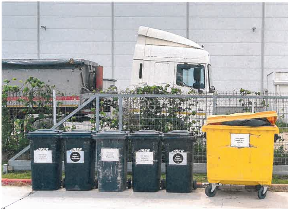
-zona depozitare temporara deseuri-