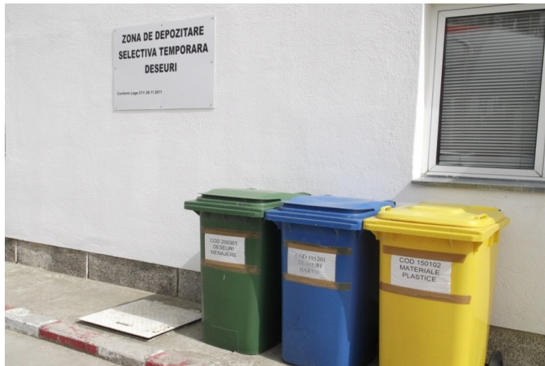
-zona depozitare temporara deseuri-

Monitorizarea deseurilor generate se face continuu iar raportarea catre autoritati se realizeaza conform cerintelor legale, conditiile Autorizatiei de mediu sau la solicitarile Agentiei pentru Protectia Mediului. Auditarea modului de gestionare a deseurilor se face in cadrul auditurilor interne si externe de mediu.