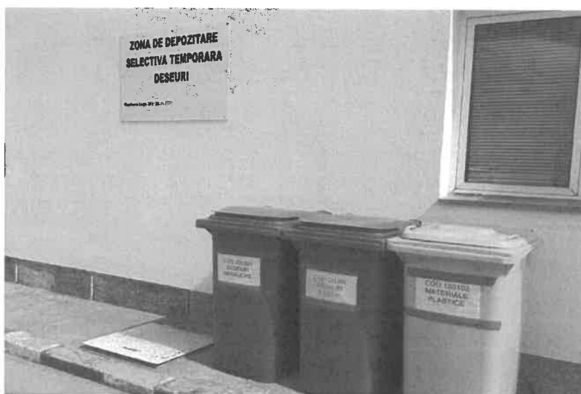
-zona depozitare temporara deseuri-

Monitorizarea deseurilor generate se face continuu iar raportarea catre autoritati se realizeaza conform cerintelor legale, conditiile Autorizatiei de mediu sau la solicitarile Agentiei pentru Protectia Mediului.