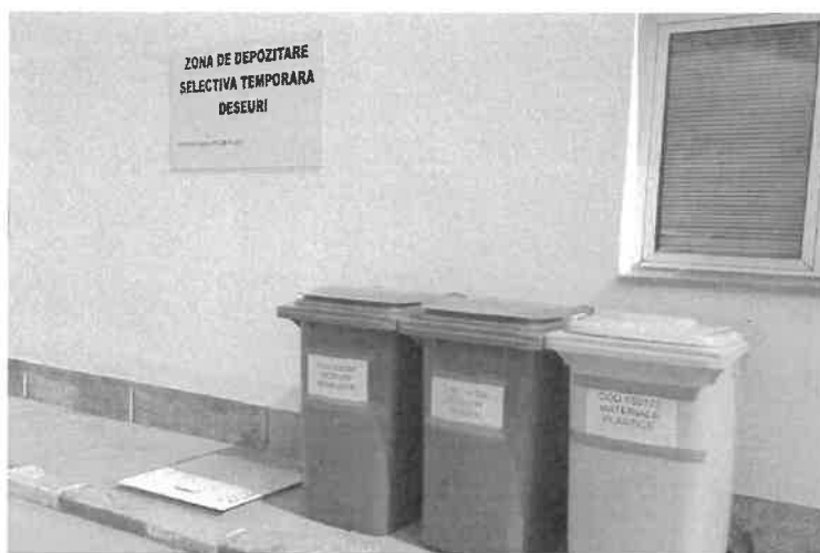
-zona depozitare temporara deseuri-

Monitorizarea deseurilor generate se face continuu iar raportarea catre autoritati se realizeaza conform cerintelor legale, conditiile Autorizatiei de mediu sau la solicitarile Agentiei pentru Protectia Mediului.