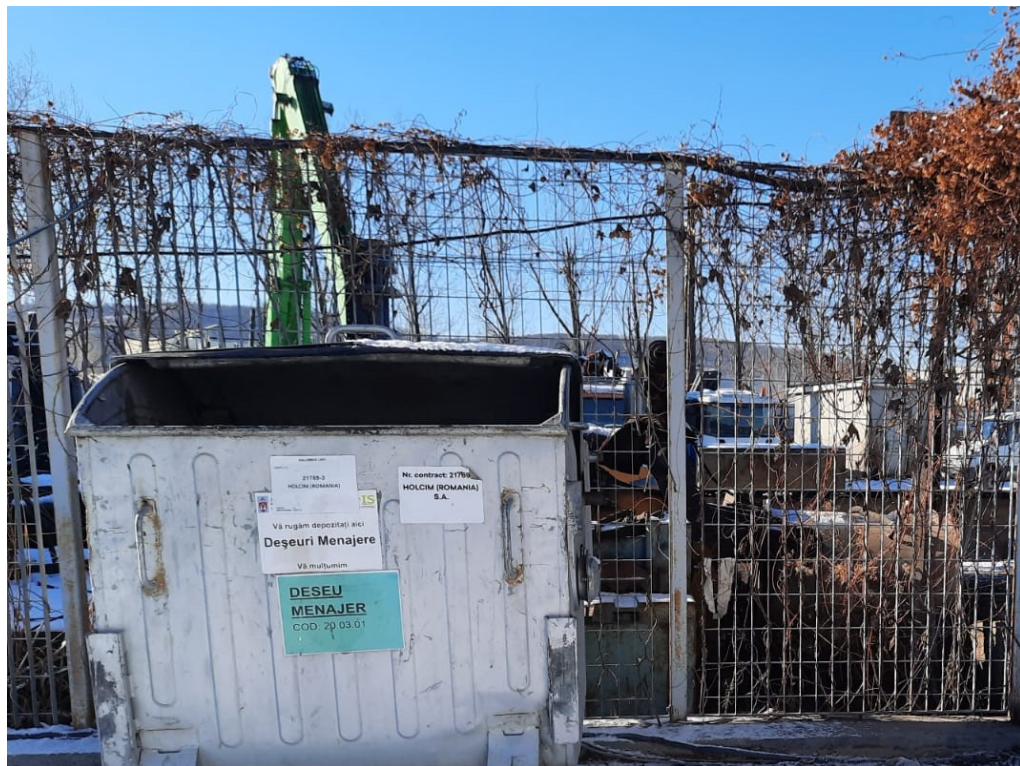
-zona depozitare temporara deseuri-