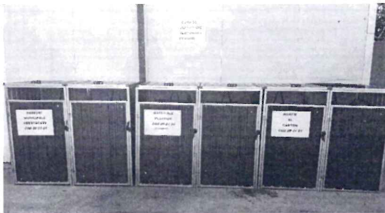
-zona depozitare temporara deseuri-