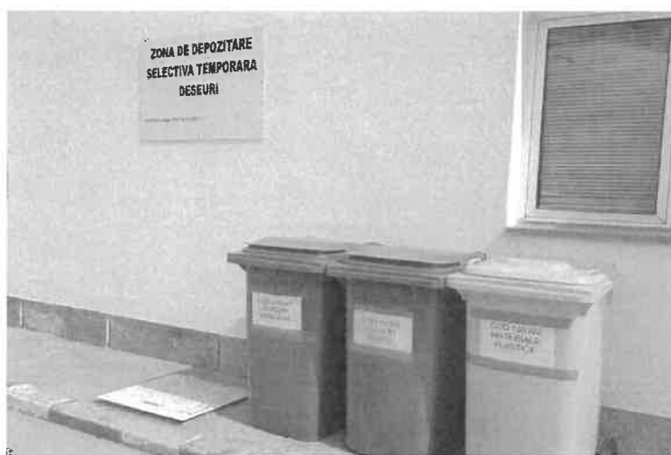
-zona depozitare temporara deseuri-