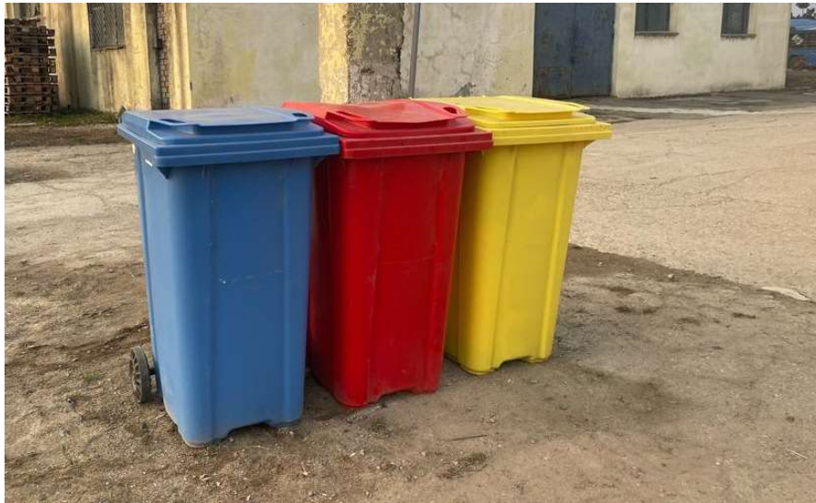
-zona depozitare temporara deseuri-